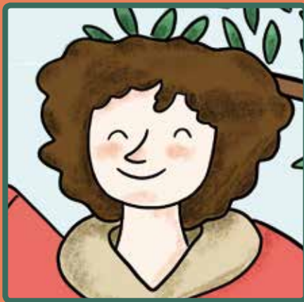
AURORA Batet Castellera