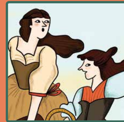
LES HEROÏNES DE SANTA BÀRBARA La resistència